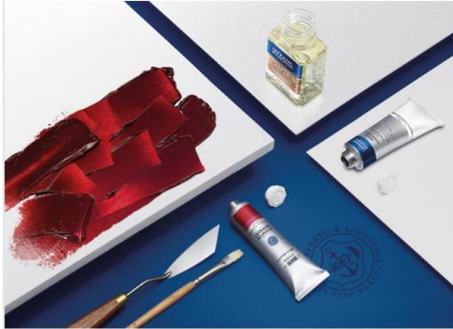
Creating with Lefranc

Pensa che la pittura sia sempre un linguaggio valido per rappresentare emozioni e opinioni? «Dipingere prima di tutto significa mescolarsi: miscela, evoluzione costante della tavolozza dei colori. Abbiamo anche sviluppato la più ampia gamma di medium (additivi) e vernici per giocare con opacità, trasparenza, impasto o fluidità e dipingere su tela, su carta, su legno o su pareti. Questo significa che la pittura apre un campo di espressione illimitato alle persone. È quindi l'unico in grado di rappresentare emozioni e opinioni e creare incredibili relazioni artistiche con il pubblico.»