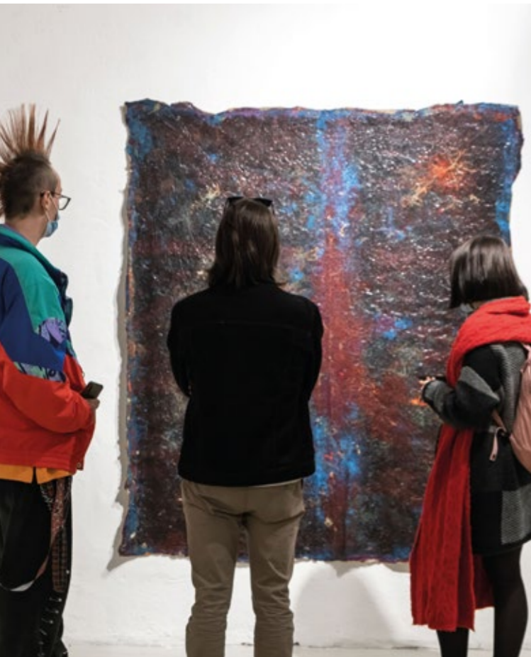
Exhibition view, photo Filippo de Majo